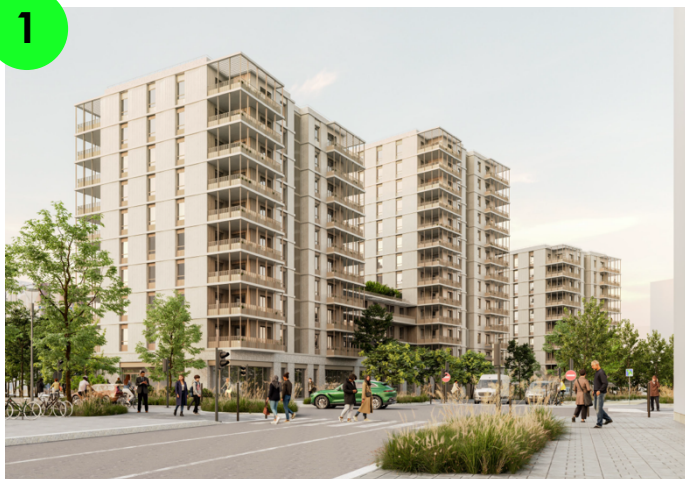
Visuel du Permis de Construire © HARDEL LE BIHAN ARCHITECTES

Promoteurs : Care Promotion, Demathieu Bard Immobilier, Coopimmo