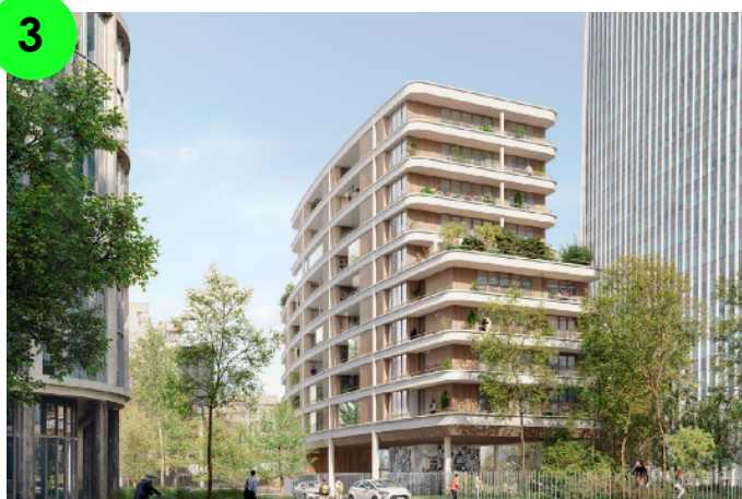
Visuel de concours © GAETAN LE PENHUELARCHITECTES_Linkcity