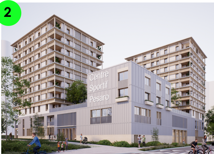
Visuel du Permis de Construire © BRENAC & GONZALEZ & ASSOCIES

Promoteurs : Care Promotion, Demathieu Bard Immobilier, Coopimmo